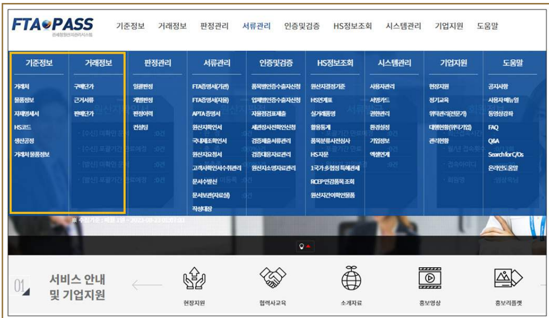
[그림 1] FTA-PASS 메뉴 화면

금번 호에서는 FTA-PASS 활용유형 중 기본형, 재고관리 기능을 사용하지 않는 유형에 대해 다루겠다. 기본형(재고관리기능 미사용)을 활용하는 회원사는 원산지확인서를 발급하기에 앞서 기준정보와 거래정보를 등록해야 한다.